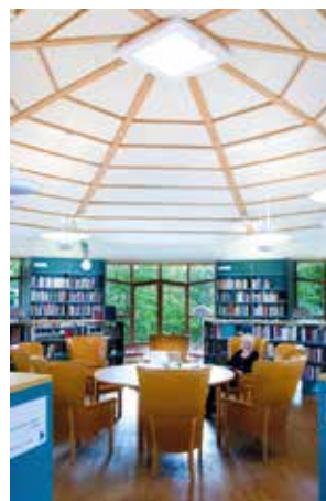
Culturum – Stadsbibliotek.