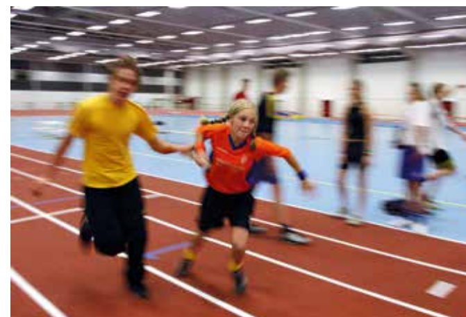
Idrottsanläggningen Rosvalla har multihall, ishockeyarenor, sporthall, flera konstgräsplaner, gym, bowling, restaurang och mycket mer.